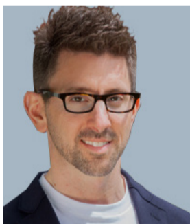
Brackett, M., Ph. D. Direttore YCEI Autore Metodo RULER