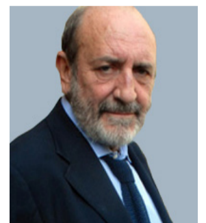
Galimberti, U. Professore Ordinario Università di Venezia